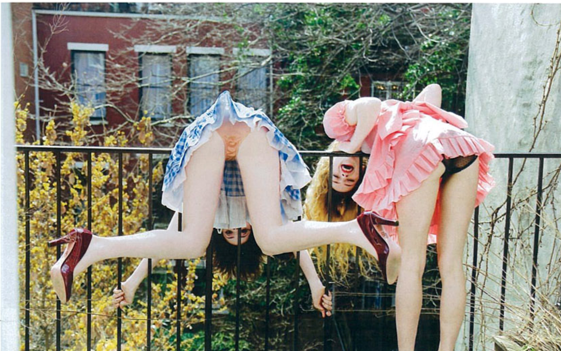
ELLEN VON UNWERTH DOUBLE TROUBLE, NEW YORK, 2008