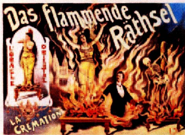
Adolph Friedländer – Poster eines unbekanntes deutschen Magiers während der Vorführung der Verbrennungssillusion, ca. 1898.