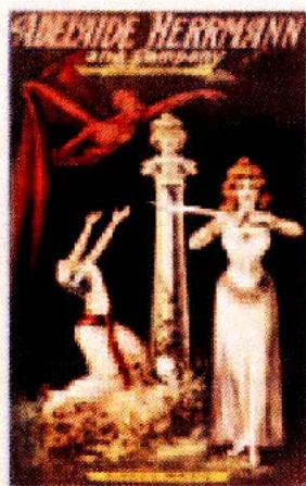
Poster der britisch-stämmigen Magierin Adelaide Herrmann, ca. 1900. Sie war zu dieser Zeit eine der wenigen weiblichen Magier, die Berühmtheit erreichten.