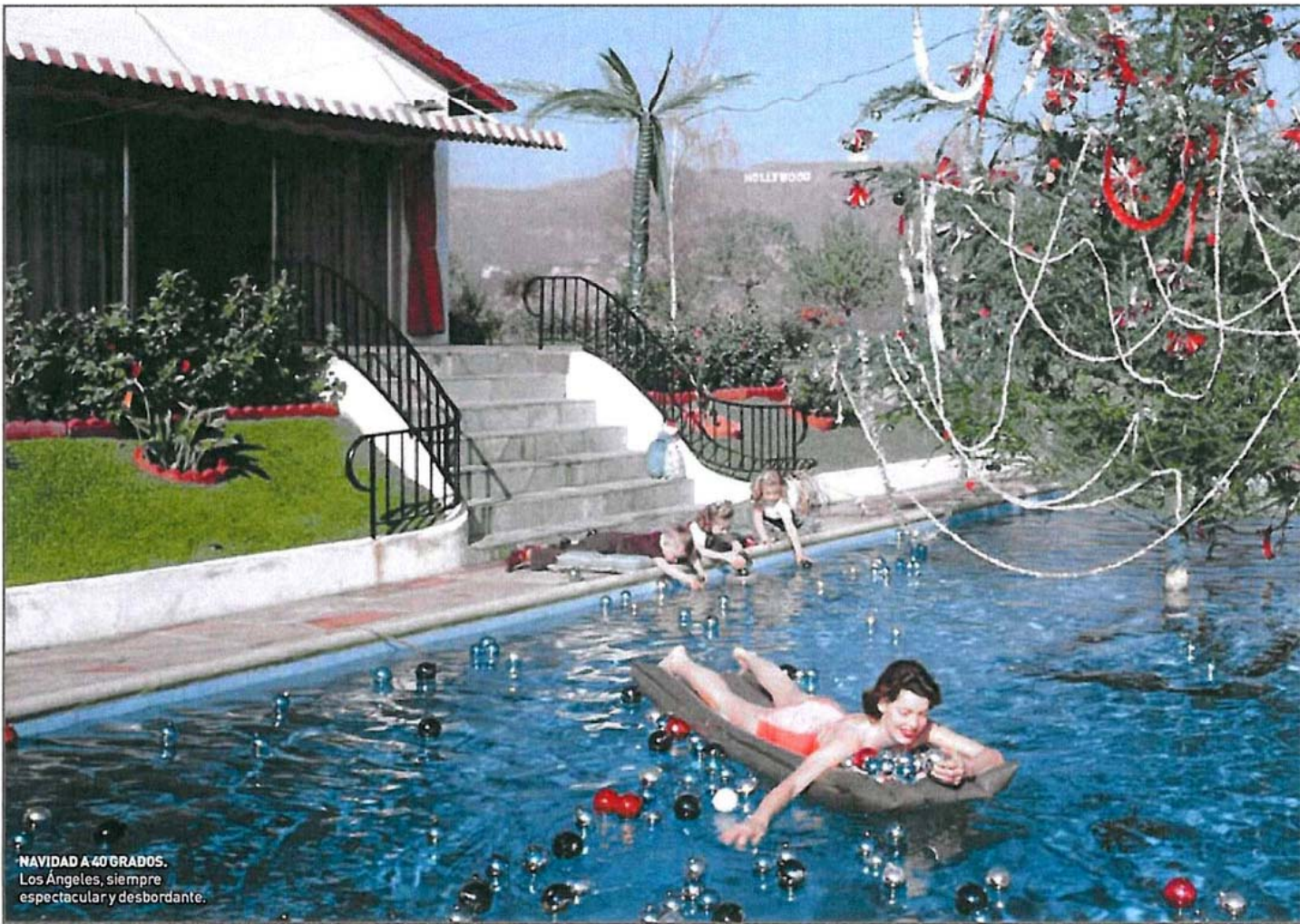
NAVIDAD A 40 GRADOS. Los Ángeles, siempre espectacular y desbordante.