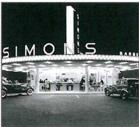
Los 'drive-in' de los cincuenta, clásico del imaginario L.A. TASCHEN