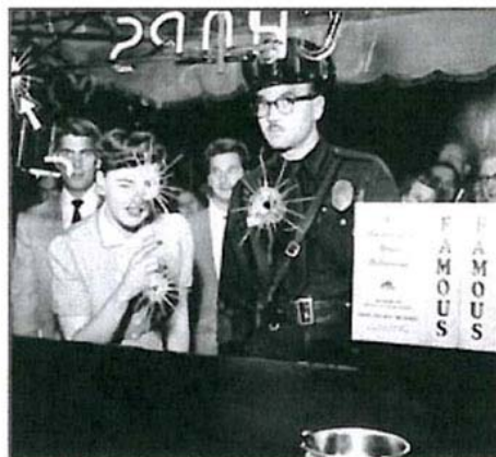
Varios curiosos observan agujeros de bala. TASCHEN