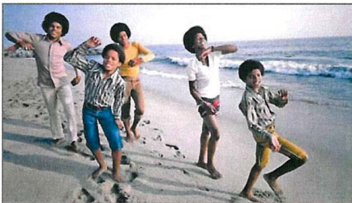
Los hermanos Jackson, de los Jackson Five, en una playa californiana.