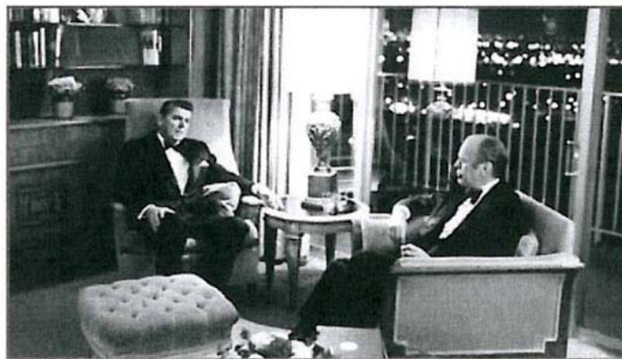
El presidente de Estados Unidos en los ochenta, Ronald Reagan, en un hotel de la ciudad. TASCHEN