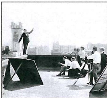
Los Ángeles es un gran plato de cine. TASCHEN