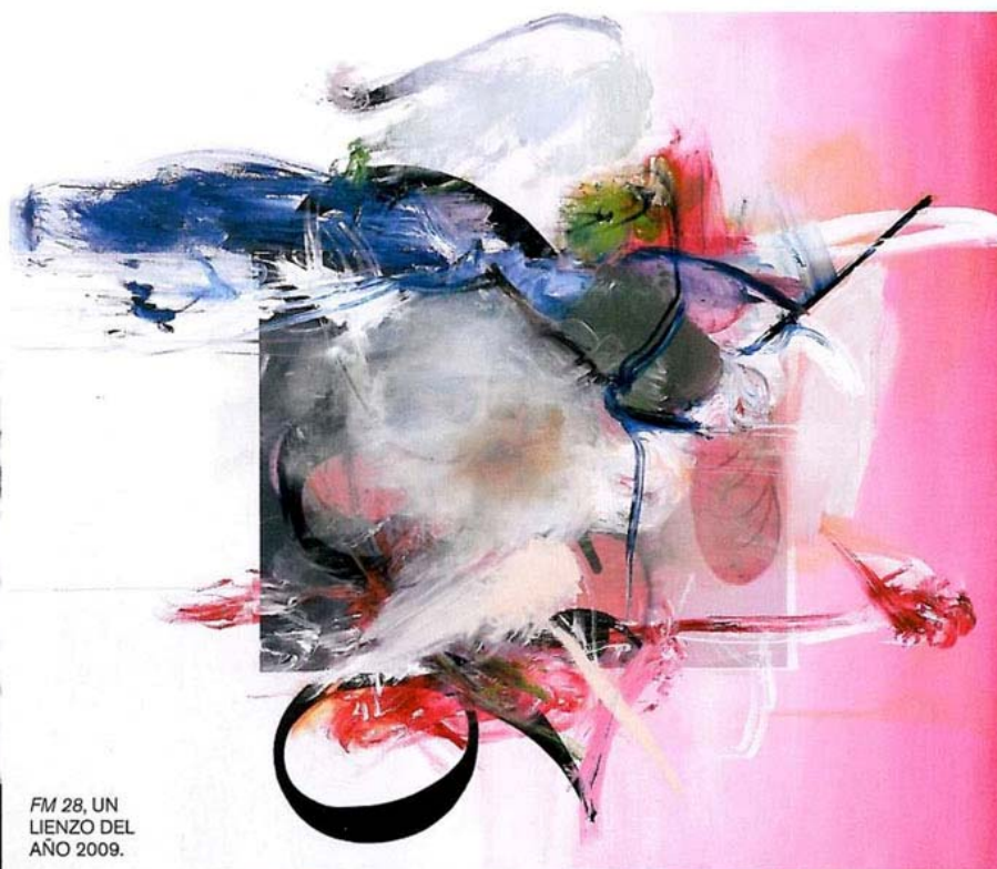
FM 28, UN LIENZO DEL AÑO 2009.