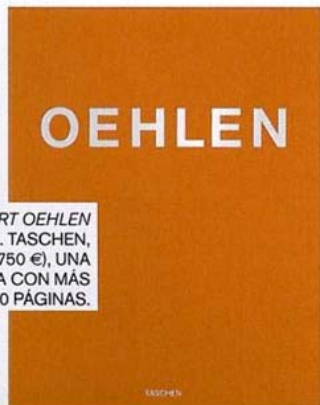
ALBERT OEHLEN (ED. TASCHEN, 750 €), UNA OBRA CON MÁS DE 660 PÁGINAS.

Los críticos encuentran referencias muy dispares en tu trabajo: Picasso, Kandinsky, Bacon, Rosenquist, Dalí, Twombly... ¿Te reconoces en ellas? Definitivamente. Los grandes artistas influyen en tu desarrollo como pintor. >