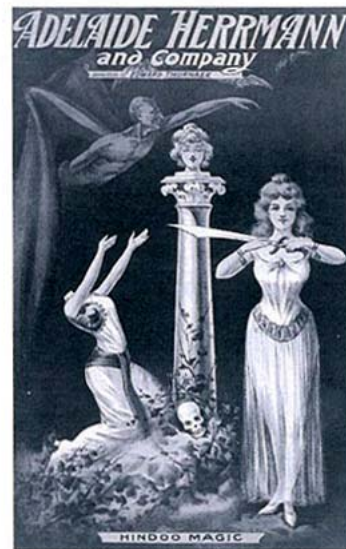
D'origine anglaise, Adélaïde Herrmann fut l'une des très rares femmes à atteindre le statut de « star » de la magie vers 1900.