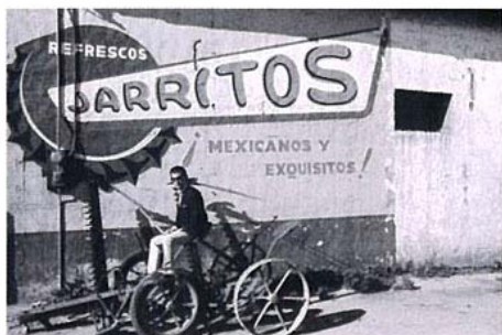
» Ci-dessus, le galeriste Robert Fraser. À droite, Martin Luther King, Alabama (1965).