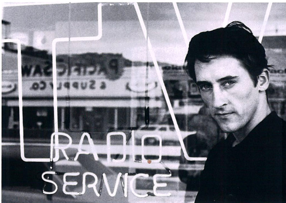
» Ci-dessous, l'artiste Ed Ruscha devant l'objectif de Hopper.

Dennis Hopper, Photographs (1961-1967). 500€.