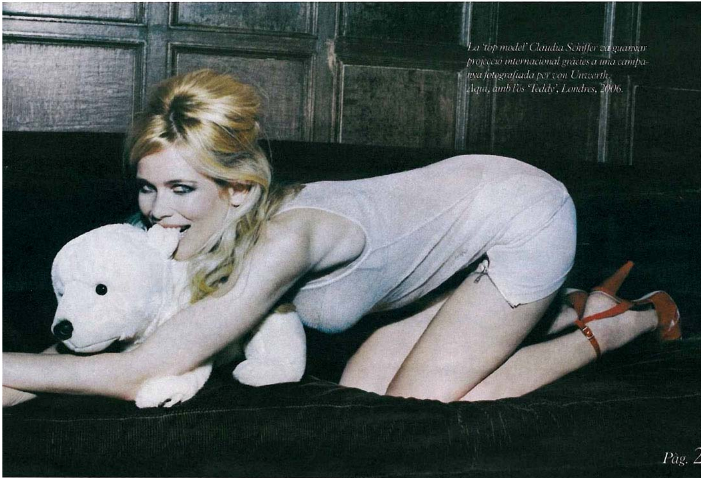
La 'top model' Claudia Schiffer va guanyar projecció internacional gràcies a una campanya fotografiada per von Unwerth. Aquí, amb l'ós 'Teddy', Londres, 2006.