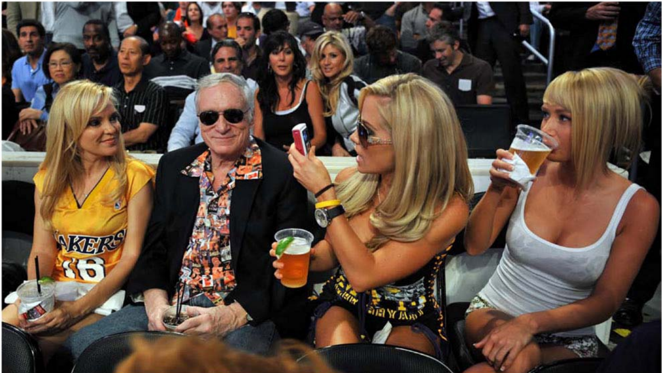
Hefner, incorregible, en un partido de Los Angeles Lakers junto a las tres rubias que conviven con él en su fastuosa mansión.

momento. Ese es el principio de la religión organizada metiéndose en política. La derecha religiosa sostuvo a Reagan, y como recompensa les entregaron esta comisión dedicada a perseguir todas las cosas eróticas.