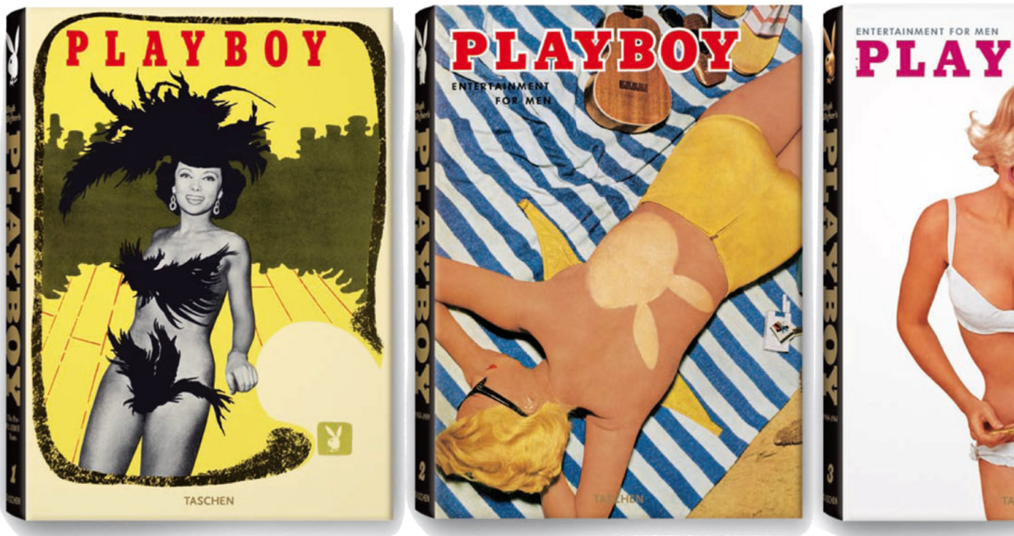
Las tapas de los volúmenes que la editorial alemana Taschen editó reuniendo las mejores fotos y artículos de Playboy entre 1953 y 1979 en

Para vender este museo portátil de Playboy es que Hefner, asistido por una de sus simpáticas nenas , acepta ponerse al teléfono de su mansión. Si existiera algo así como el ring-