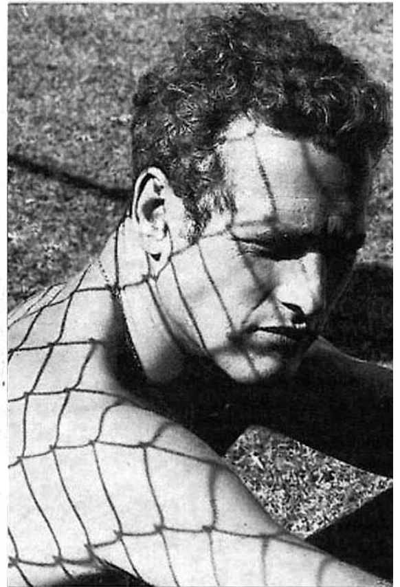
►► A la izquierda, la portada del volumen 'Photographs 1961-1967'. Arriba, una instantánea de su amigo Paul Newman, en 1964.

IMÁGENES DESCARNADAS // Entre algunas de sus reflexiones, queda patente que el actor intuyó que «estaba haciendo algo que pensaba que podría tener cierto impacto algún día». «En muchos sentidos, son realmente estas fotografías las que me mantuvie-