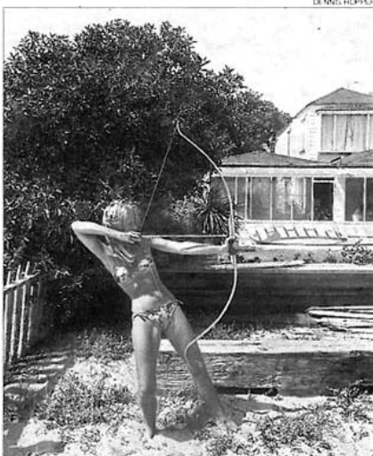
►► Hopper retrató también a la actriz Jane Fonda, en 1969.

ron activo creativamente», afirma. Para él, «la obra es la fotografía como película, una narración apasionante expresada mediante una serie de imágenes descarnadas: las tomas tempranas de corridas de toros en Tijuana, los happenings en Los Ángeles y las escenas callejeras muestran una libertad experimental que se traduciría en la vívida imaginaria cinematográfica de Easy Rider y más allá». ≡