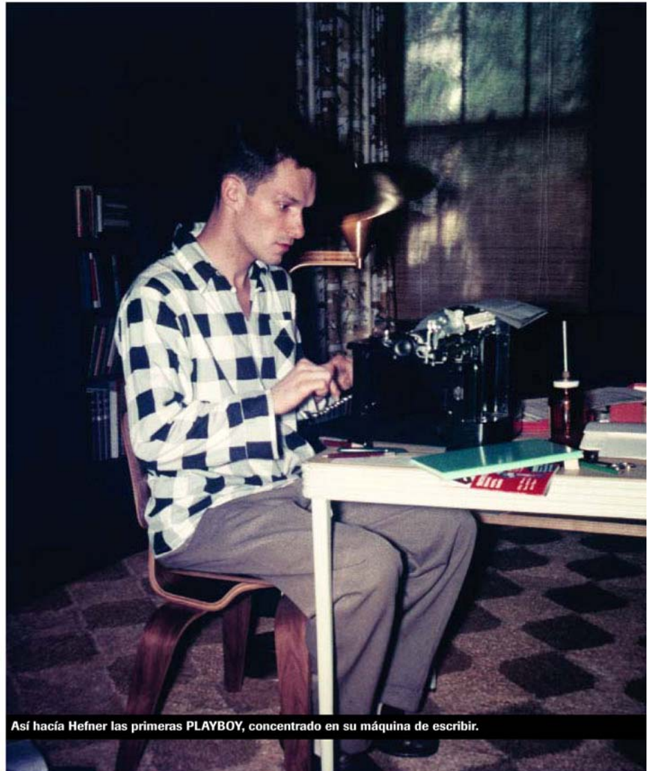
Así hacía Hefner las primeras PLAYBOY, concentrado en su máquina de escribir.

Ah, sí. Siendo periodista, uno tiende a registrar, y esta era mi manera de registrar la vida. Soy