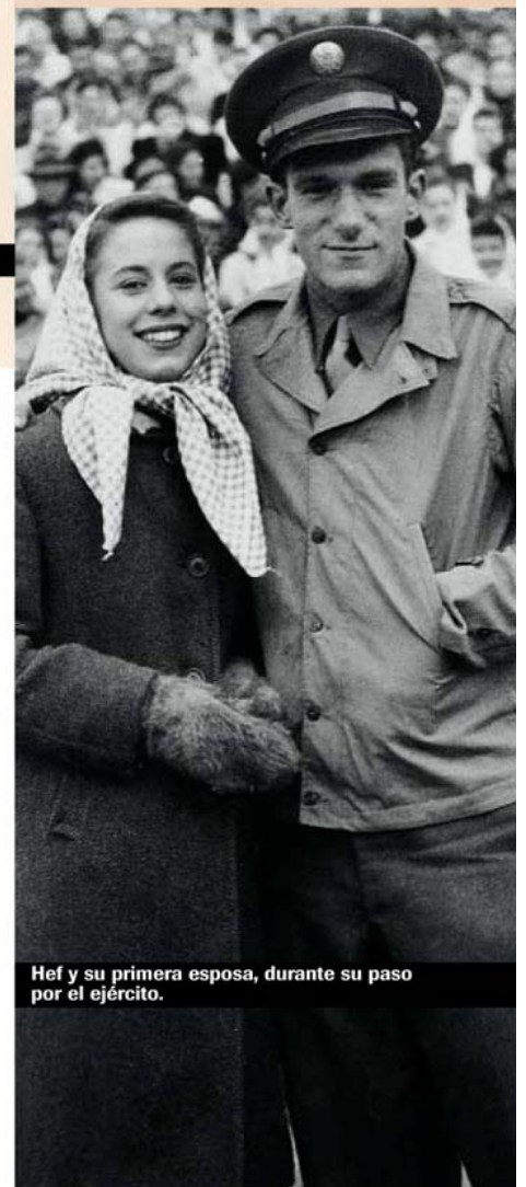
Hef y su primera esposa, durante su paso por el ejército.