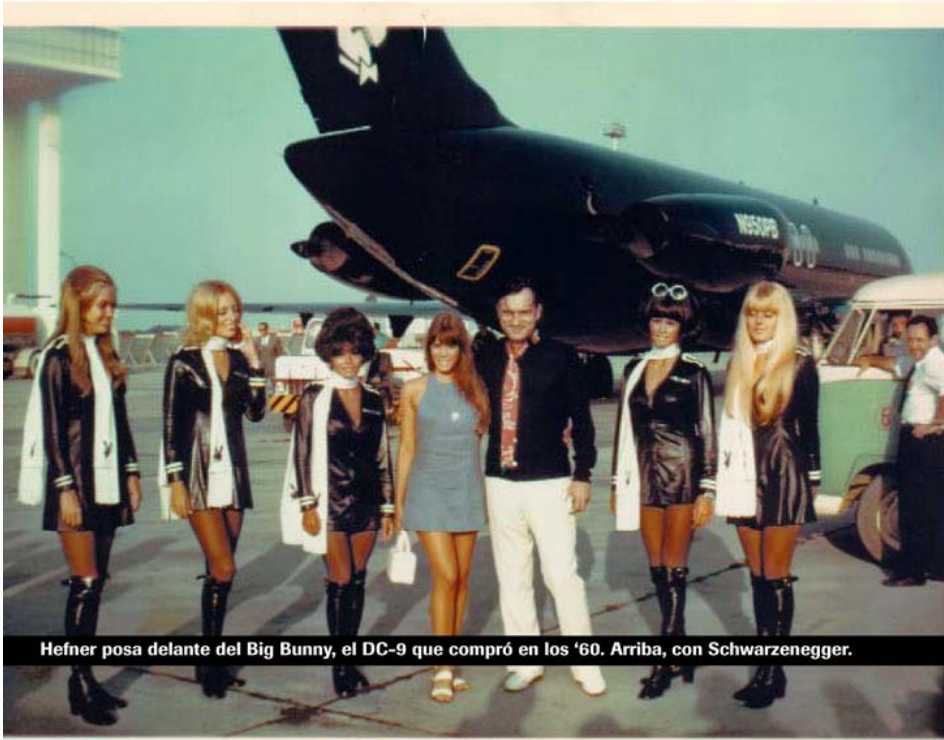
Hefner posa delante del Big Bunny, el DC-9 que compró en los '60. Arriba, con Schwarzenegger.