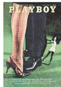
Maio de 1965: busca pela sofisticação além do nu