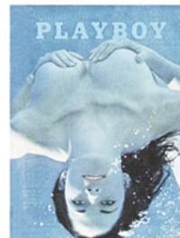
Julho de 1970: prenúncio da década dos excessos