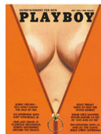
Julho de 1973: grafismo, cores e seios grandes