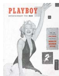
Dezembro de 1953: a primeira das mais de 600