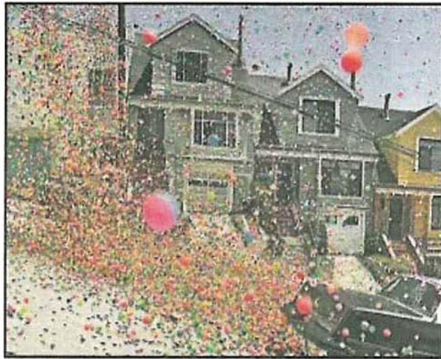
Imagen del anuncio 'Balls' de Sony.