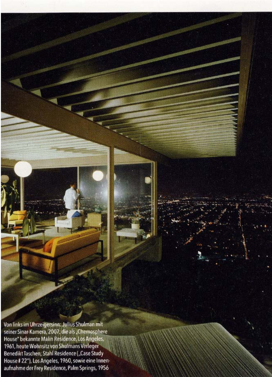
Von links im Uhrzeigersinn: Julius Shulman mit seiner Sinar-Kamera, 2007; die als „Chemosphere House“ bekannte Malin Residence, Los Angeles, 1961, heute Wohnsitz von Shulmans Verleger Benedikt Taschen; Stahl Residence („Case Study House # 22“), Los Angeles, 1960, sowie eine Innenaufnahme der Frey Residence, Palm Springs, 1956

seinen Bildern und machten sich auf in das Gelobte Land.