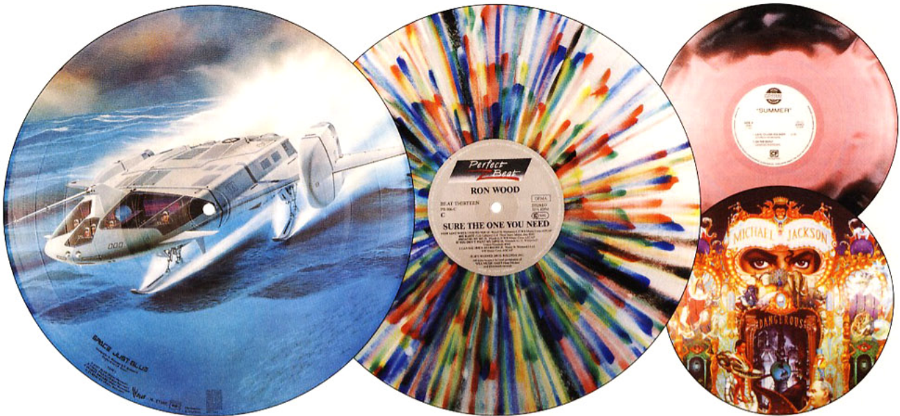
„Just Blue“ von Space (1978), „Sure the One You Need“ von Ron Wood (1974), „Summer“ von Donna Summer (Bootleg von 1997), „Dangerous“ von Michael Jackson (1997)