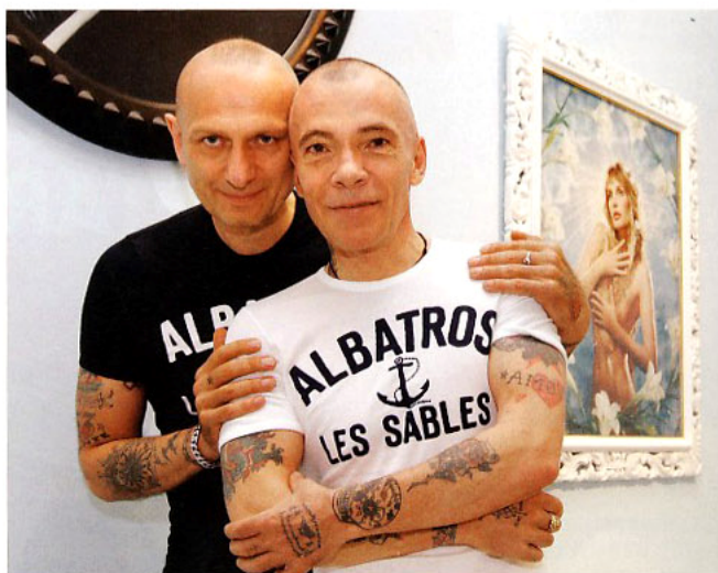
Im Laufe der Jahre sind ihre Haare spärlicher, die Tattoos flächendeckend geworden: Pierre (rechts) und Gilles 2007 bei einer Ausstellungseröffnung

Immer suchen sie Motive, in denen eine Geschichte steckt. Etwa das Porträt des in der Bretagne geborenen Kunstsammlers François Pinault, den sie als Kapitän Nemo zeigen, umringt von Taucherhelm, Seehund und Tiefseefischen. Den vom Meer und von der Kunst besessenen Abenteurer, der eingeschlossen bleibt in seiner Obsession, dem U-Boot Nautilus. Und dem Kunstsammeln. Den Sänger Serge Gainsbourg haben sie als weinenden Weihnachtsmann inszeniert, seinen Kollegen Marc Almond als menschliche Vanitas. Natürlich fotografieren Pierre et Gilles nicht nur Männer. Auch Nina Hagen, Mireille Mathieu oder Amanda Lear treten auf, Frauen, die ihren Mann stehen. In den liebevollen Fotos der beiden wird das schwache zum starken Geschlecht, die Frau nicht zum Objekt der Begierde, sondern zur Madonna. Die gleichnamige Sängerin wird zur guten Fee aus 1001 Nacht. Und wo die Männer, selbst die Heiligen, jung, nackt und sexy sind, bleiben die Frauen meist züchtig und bekleidet, sie schweben als Ikonen über den alltäglichen Schlachten des Liebeskriegs. Auch das eine Form von zeitgemäßer Romantik, kein Kitsch. a