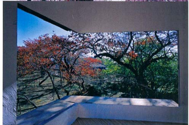
Maison de thé Tetsu, Musée Kiyoharu Shirakaba, Nakamaru, Hokuto City, Yamanashi, 2005.