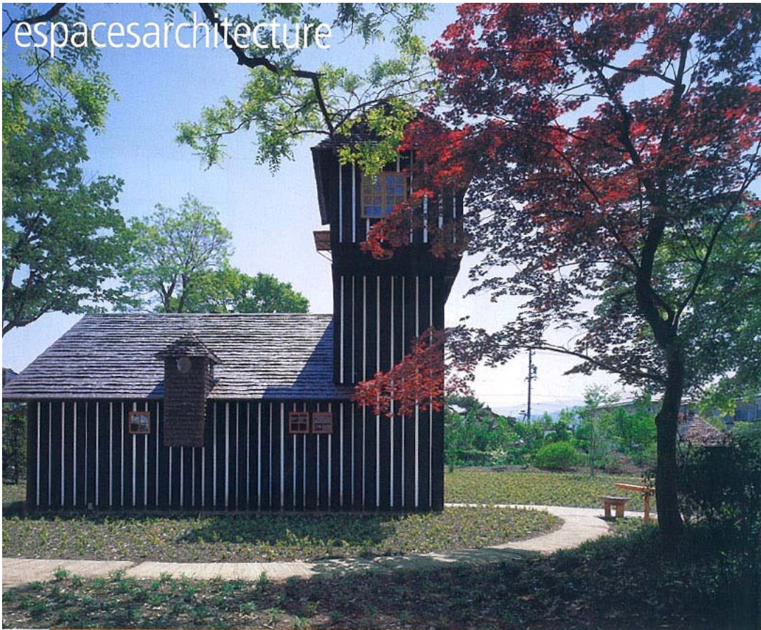
Charred Cedar House de Fujimori Nagano City, Nagano, 2006-07.