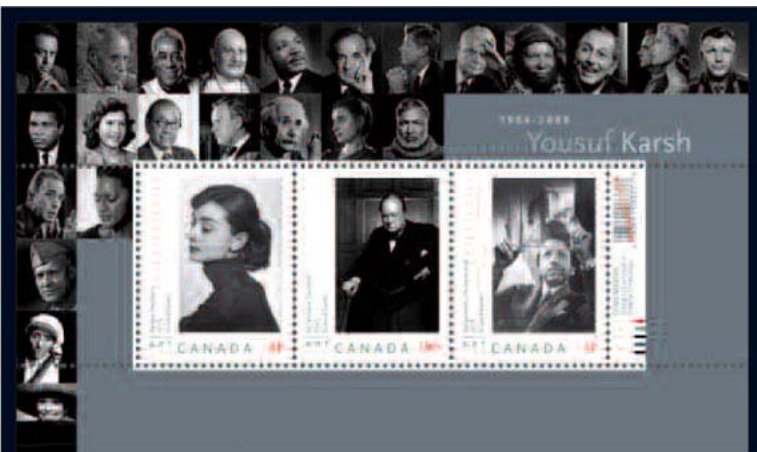
Foglio filatelico di una emissione canadese del 21 maggio 2008, nel centenario della nascita di Yousuf Karsh. Tre valori: autoritratto del 1952, ritratto del primo ministro inglese Winston Churchill, del 1941, anche copertina di Life del 21 maggio 1945 (curiosamente, trentasettesimo compleanno del fotografo), e ritratto dell'attrice americana Audrey Hepburn, del 1956.

Yousuf Karsh. Ritratti; a cura di Grazia Neri; selezione antologica di stampe vintage dagli anni Trenta. Galleria Carla Sozzani, corso Como 10, 20154 Milano; 02-653531. Dal 6 settembre all'11 ottobre; lunedì 15,30-19.30, martedì, venerdì, sabato e domenica 10,30-19,30, mercoledì e giovedì 10,30-21,00.