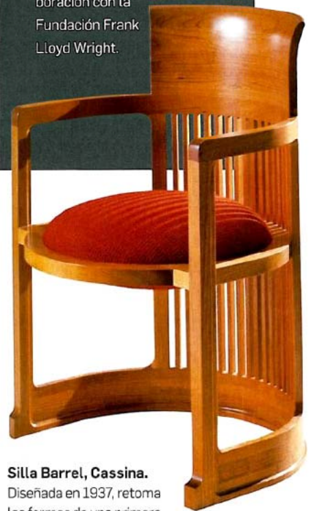
Silla Barrel, Cassina. Diseñada en 1937, retoma las formas de una primera silla de tubo de 1904.