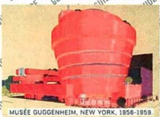
MUSÉE GUGGENHEIM, NEW YORK, 1956-1959.