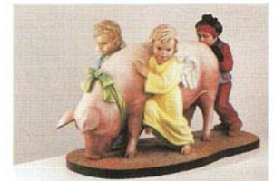
US$70 ES UN PRECIO IRRISORIO PARA TENER TODAS LAS OBRAS DE JEFF KOONS EN SU CASA.