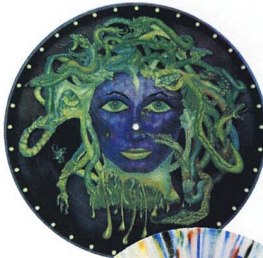
Kunst auf der Platte: „The Label“ von Various Artists (1979) (oben) und

Trotzdem wird farbiges Vinyl meist nur für eine begrenzte Auflage von 2000 oder 500 Platten verwendet. Und was selten ist, hat einen hohen Wert. Die orangefarbene italienische Ausgabe von Pink Floyds „The Wall“ etwa kostet 1800 Euro. Und was hohen Wert hat, gehört ausgestellt. Lange also ist eine Sammlung dieser Plattenästhetik überfällig. Das Buch „Extraordinary Records“ zeigt über 400 Schallplatten - ihre Farben und ihre Formen. Kaum ein Künstler der Popgeschichte, der nicht in „Extraordinary Records“ vertreten ist: David Bowie, Queen, Prince, die Beatles, Michael Jackson und natürlich Elvis Presley. Die Individualität der Künstler spiegelt sich in der Gestaltung der Platten. Von gold bis durchsichtig, mal bemalt, mal bedruckt, mal leuchten sie im Dunkeln. Eine LP ist wie eine Pizza mit Tomaten und Paprika belegt. Einer Platte der Simple Minds im violetten Batik-Muster folgen die sogenannten Shaped