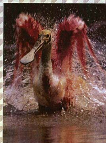
巴西薔薇色的麗鷗正在忘我地享受沐浴。