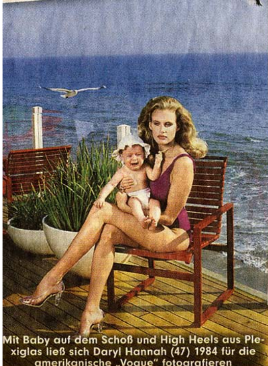
Mit Baby auf dem Schoß und High Heels aus Plexiglas ließ sich Daryl Hannah (47) 1984 für die amerikanische „Vogue“ fotografieren