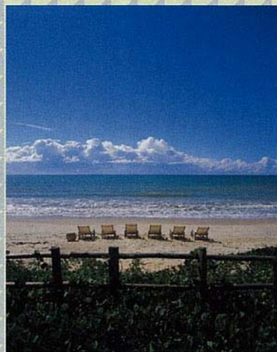
一位愛上了BAHIA景色的歐洲人特別請建築師為他設計了一間以大自然為主題的別墅，門前已是一覽無遺的碧海，八月的時候還可安坐在躺椅上觀看鯨魚南遷！