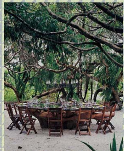
在這樣的環境下和親朋好友吃飯，就算只是普普通通的食物，相信亦能媲美高級食府！

以前想享受一個陽光與海灘的假期，香港人的普遍選擇為峇里、馬爾代夫等；但是近年來，不少人開始尋找一些特別的地點，除了有點新鮮感外，又可避免走到哪裡都碰到香港人的情況。