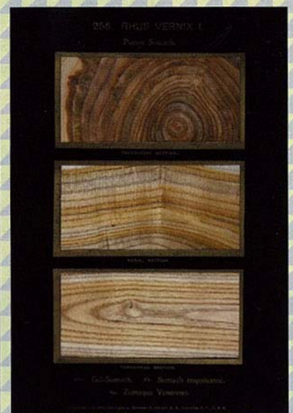
上中下分別為橫切面、徑切面及弦切面。

相信不少從事設計行業的讀者都會有一疊 pantone colour guide，以便隨時對色或找尋顏色的靈感。類似的 remarkable reference guide 就有一套比 pantone 更早出現，花了 25 年才製成，不過 reference 的並非顏色，而是 350 種源自美國的木材。