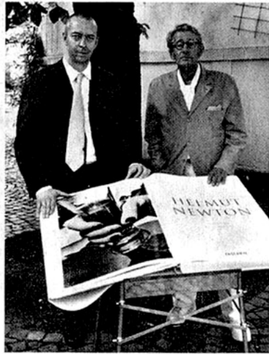
Helmut Newton und Benedikt Taschen (l.) mit dem „Sumo“-Buch

eher die Schattenseiten des 20. Jahrhunderts, insbesondere an den Stellen, wo sie auf der Sonnenseite des Lebens aufgenommen zu sein scheinen: Die schönsten Frauen der Welt bekommen bei ihm einen Zug ins Bedrohliche, und all die schönen Beine gehen auch mal ganz alleine, getrennt vom Körper, durchs Bild, ragen leblos aus Mülltüten am Strand oder werden von orthopädischem Spezialmaterial