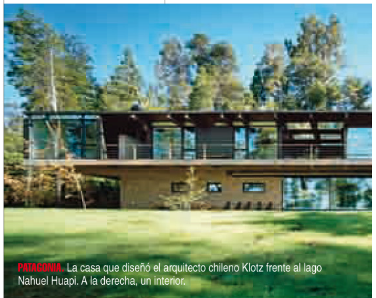
PATAGONIA. La casa que diseñó el arquitecto chileno Klotz frente al lago Nahuel Huapi. A la derecha, un interior.

El chileno es uno de los arquitectos más reconocidos de su generación.