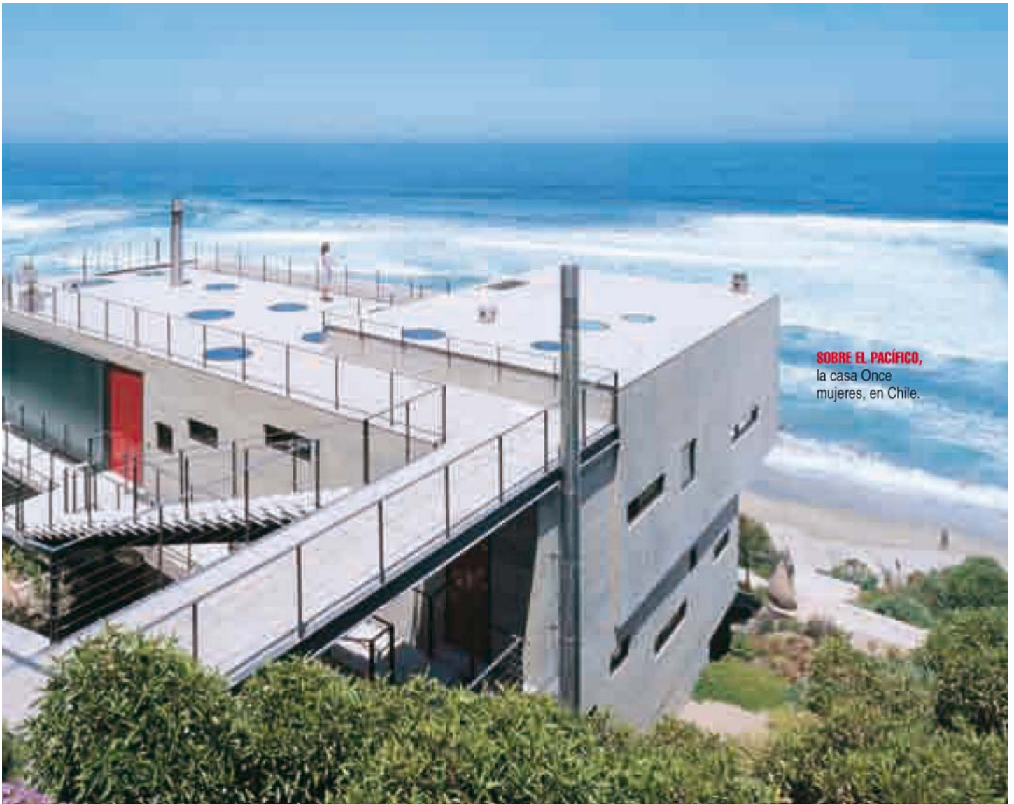
SOBRE EL PACÍFICO, la casa Once mujeres, en Chile.

Justamente, la GA Gallery de Tokio lo eligió hace cinco años junto a otros seis colegas, para una muestra de lo