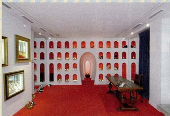
CHRISTIAN LOUBOUTIN地道巴黎出生的CHRISTIAN LOUBOUTIN，店舖貫徹品牌標誌紅色鞋底的特色，地氈理所當然選紅色，美麗的鞋子一雙雙收納在紅色的壁龕內。