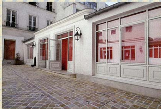
COMME DES GARCONS 川久保玲的THE CHILI-PEPPER RED CHILL-OUT LOUNGE。

《TASCHEN'S PARIS》 hardcover · 23.8 × 30.2 cm (9.4 × 11.9 in.) · 400 pages 今年還會推出《TASCHEN'S NEW YORK》、 《TASCHEN'S BERLIN》及 《TASCHEN'S LONDON》。