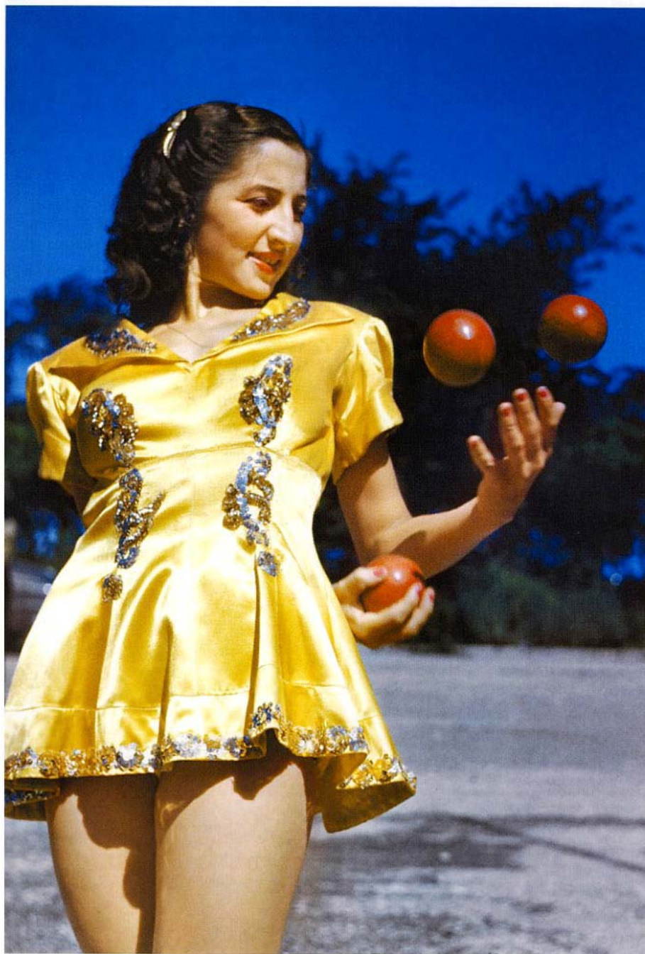
Cirkusový festival v New Orleansu v roce 1952