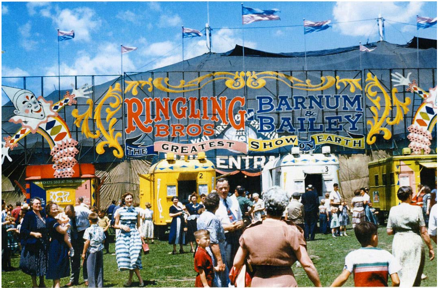
Ringling Bros and Barnum & Bailey proslavila show, ve které představili lidi i zvířata z celého světa.

Sláva amerického cirkusu stále narůstala, představení pravidelně navštěvovaly miliony lidí, ale i přes obrovskou popularitu přišel prudký pád. Tou pohromou se pro cirkusy stala třicátá léta, během nichž světem zmítala hospodářská krize a nástup nových forem zábavy, především kinematografie. Některé cirkusy proto nadobro zavřely. Vzápětí přišla druhá světová válka a každý, kdo měl správný počet končetin, byl naverbován. Po čtyřech válečných letech tak prakticky cirkusy přestaly existovat a po válce se jen obtížně obnovovaly: další ránu zasadila pandemie španělské chřipky. Po ní se už tradice klasických cirkusů se zvířaty, astrology a hříčkami přírody nikdy neobnovila v takové míře. O to víc se však jeho dnešní následovníci z Kanady, Francie či Skandinávie soustřeďují na akrobatické výkony, jež se zdají být za hranicí lidských schopností a fyzikálních možností. A show jede dál.