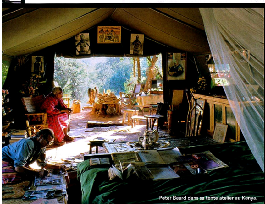
Peter Beard dans sa tente atelier au Kenya.