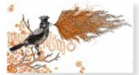
> Hula Hula