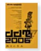
> Héctor Montes de Oca