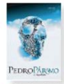
> Domingo Noé