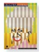
> German Montalvo