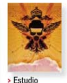
> Estudio Monitor