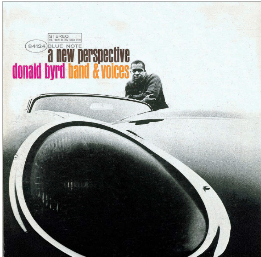
Der Jazz-Trompeter Donald Byrd als cooler Autobesitzer: Foto und Design für das LP-Cover von 1963 besorgte Reid Miles.

Die entscheidende ästhetische Kehrtwende begleitet die Intellektualisierung des Jazz in den späten 50ern um Miles Davis, John Coltrane, Thelonious Monk oder