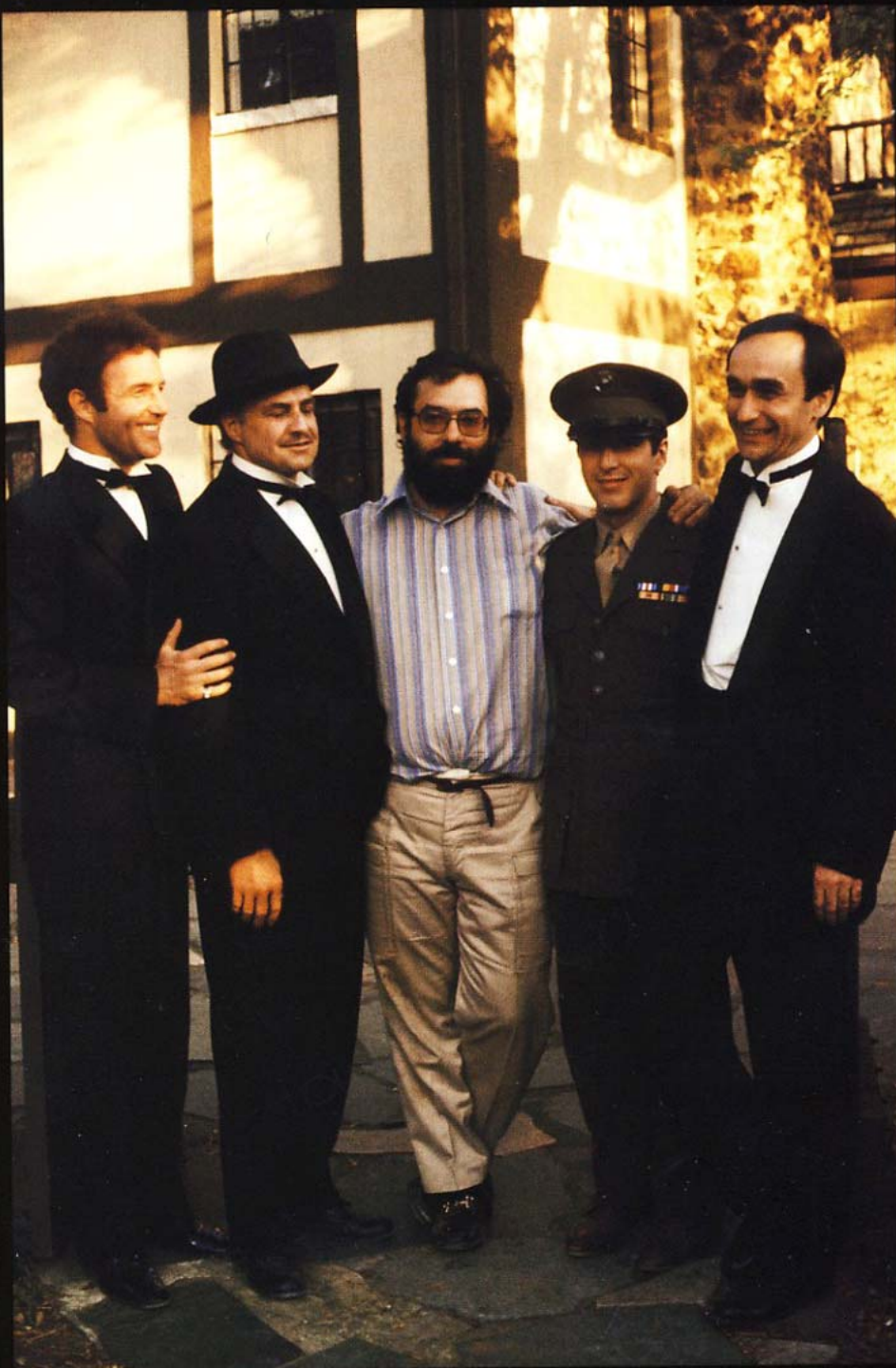
portrét režiséra Francise Forda Coppoly společně s Jamesem Caanem, Marlonem Brandem, Al Pacinem, a Johnem Cazalem.

Asi není třeba dlouze vysvětlovat, kdo je Steve Schapiro, že? Slavný fotograf pracující pro nejslavnější média, jehož práce naleznete v mnoha muzejních sbírkách a samozřejmě v jeho slavných knihách „American Edge“ a „Schapiro's Heroes“. Jeho fotky vyšly na titulních stranách slavných světových časopisů včetně Life, Look, Time, Sports Illustrated, Paris Match a také na úplně první obálce časopisu People. V Hollywoodu pracoval na fotografiích z více než 200 filmů; jeho nejnámější filmové plakáty jsou z filmů Půlnoční kovboj, Taxikář, Parenthood a Kmotr III. □