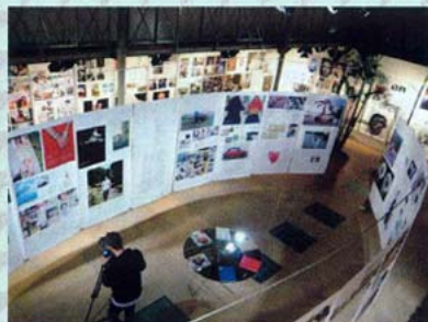
本月在巴黎時裝設計師AZZEDINE ALAIA的LOFT GALLERY內舉行的《SOUL i-D》展覽(7-30 Nov)，明年將移師至倫敦及紐約。