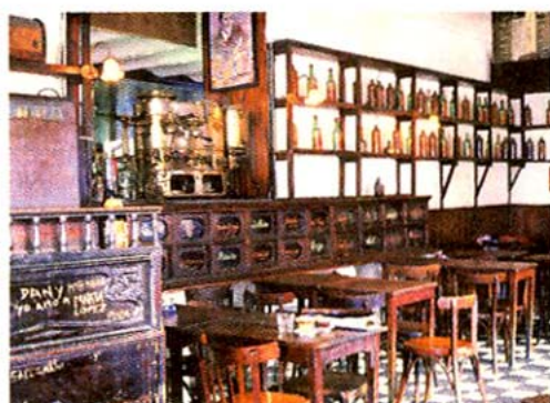
Zeugen der Vergangenheit: verstaubte Weinflaschen in der Plaza-Dorrego-Bar

Wohl selten war in einem Städte-Bildband so wenig Stadt zu sehen wie in „Buenos Aires Style“ aus dem Taschen Verlag. Doch das wundert nicht, denn das Buch erscheint dort in der „Icons“-Serie. Und in der geht es um Kunst-richtungen und um Innenräume, um Gesichter, die Geschichte geschrieben haben, und um Städte, die Stilrichtungen festlegen.