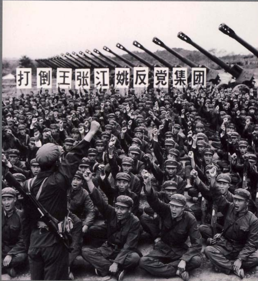
Hiao Zhuang, 1976

Kundgebung der Volksbefreiungsarmee in Nanjing, Provinz Jiangsu, bei der „Wang, Zhang, Jiang, Yao“, die Viererbande, gebrandmarkt werden sollte.