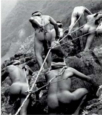
Chinesische Arbeiter ziehen ein Boot den Fluss Jangtse hinauf, was sie zur Schonung ihrer wenigen Kleidungsstücke nackt erledigen. Foto: Quin Wen 2005

durch den Asien-Spezialisten James Kyng und einer Art Analyse der chinesischen Fotografie durch die in Peking lebende Kunstkritikerin und Kuratorin Karen Smith gliedert sich der Band in die Abschnitte 1949 bis 1959: „Die Geburt des neuen China“, 1960 bis 1969: „Der große Sprung zurück“, 1970 bis 1979: „Misstrauen, Verrat und andauernder Wahnsinn“, 1990 bis 1999: „Taten sprechen lauter als Worte“ und 2000 bis today: „China tritt der Welt bei“. Jeder dieser Abschnitte enthält eine knappe Einführung des Herausgebers, in der er den historischen Kontext, in dem die dann folgenden Bilder stehen, erläutert. Auch jedem einzelnen Foto ist eine genaue Beschreibung zur Seite gestellt. Den Abschluss des monumentalen Werkes bilden eine Chronologie „China: Kaiserreich – Republik – Volksrepublik“, eine Chinakarte, Kurzbiographien der Fotografen, Bibliographie, Zitatennachweise und Index. Ein Gedanke, der sich beim