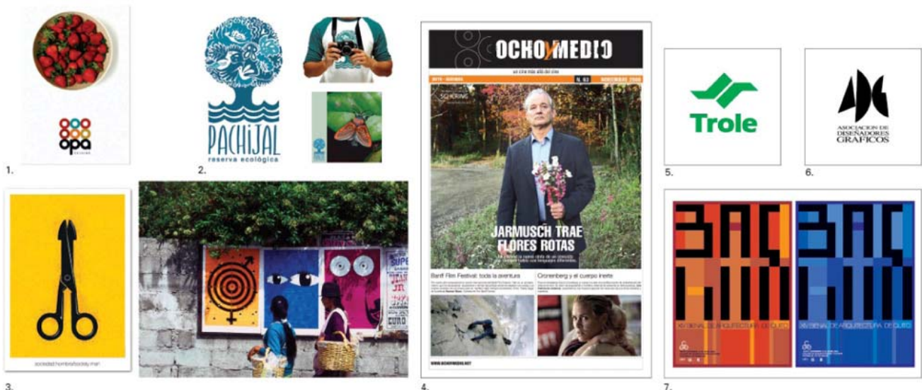
BELÉN MENA: 1. LOGOTIPO E IDENTIDAD CORPORATIVA OPA CUISINE, 2. LOGOTIPO PARA LA RESERVA ECOLÓGICA PACHIJAL, 3. PROYECTO DE AFICHES "SOCIEDAD" EJECUTADO CON SILVIO GIORGI; DIEGO CORRALES: 4. DISEÑO EDITORIAL PARA CINE OCHO Y MEDIO, 5. LOGOTIPO PARA EL TROLE, SISTEMA DE TRANSPORTE PÚBLICO DE QUITO; RÓMULO MOYA: 6. LOGOTIPO PARA LA ASOCIACIÓN DE DISEÑADORES GRÁFICOS, 7. SERIE DE 4 CARTELES PARA LA XIV BIENAL PANAMERICANA DE ARQUITECTURA DE QUITO.