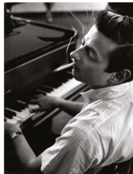
STILSIKKER: André Previn ble fotografert av Claxton i Hollywood.

■ Jubileums-utgaven av boka «Jazz Life» blir gitt ut av forlaget Taschen. Boka er skrevet på engelsk, tysk og fransk.