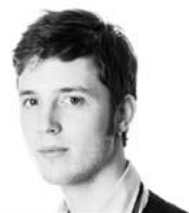
Alexander M. Schindler

Den amerikanske fotografen William Claxton er død. Arven hans er jazz-musikkens historie fortalt i bilder.