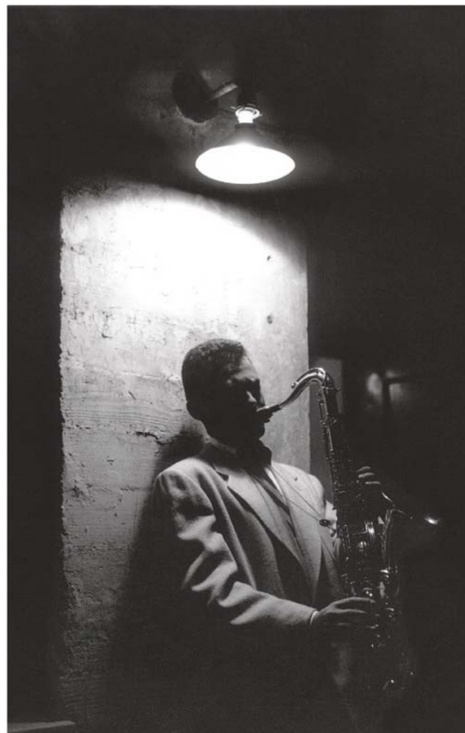
NATTESTID: Ifølge William Claxton var de fleste jazz-musikerne nattmennesker. De sov om dagen og spilte om natta.