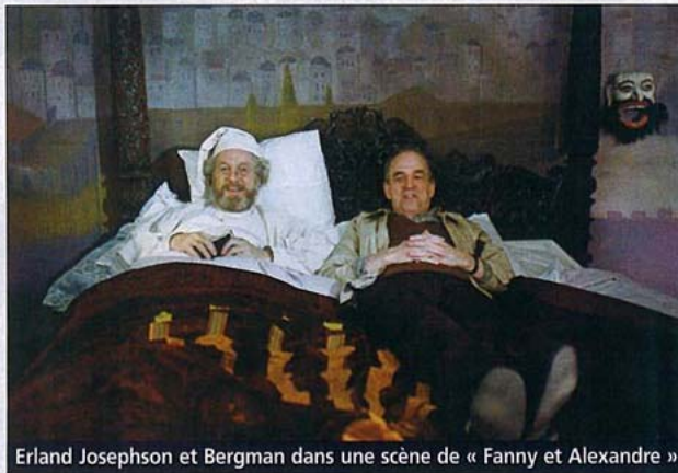
Erland Josephson et Bergman dans une scène de « Fanny et Alexandre »

1982 AB Svensk Filminstitut, Svenska Filminstitutet