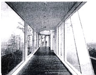
Aussicht ins Rheintal: Das Arp-Museum in Remagen-Rolandseck

Weiß, immer wieder ein reines, strahlendes Weiß. Das ist das Markenzeichen des amerikanischen Architekten Richard Meier, dessen Bauten zwar durchaus unterschiedliche Formen annehmen können, fast immer jedoch nur eine Farbe haben – egal, wo auf der Welt sie stehen. So ist auch Meiers einziger Bau im Rheinland, das im vergangenen Jahr fertig gestellte Arp-Museum, malerisch in Remagen-Rolandseck