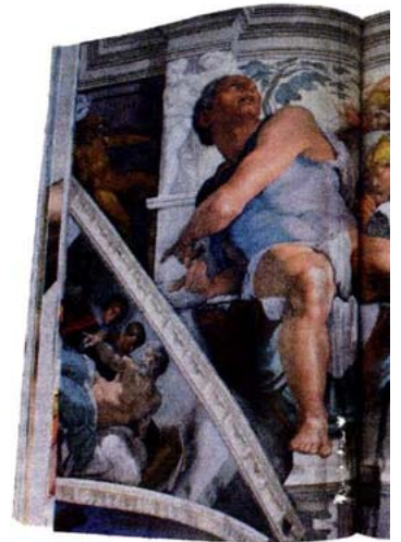
Jona met de walvis, in de Sixt

Een mastodontische oeuvercatalogus en een speurtocht naar 'geheime boodschappen' in de Sixtijnse kapel pretenderen nieuw licht op Michelangelo te werpen. Maar waarom worden sommige tekeningen zonder argumenten afgewezen en hoe zit het met die geheimzinnige verwijzingen in zijn schilderijen? Hoe het ook zij, de meesterwerken komen dankzij de robuuste reproducties heel nabij.