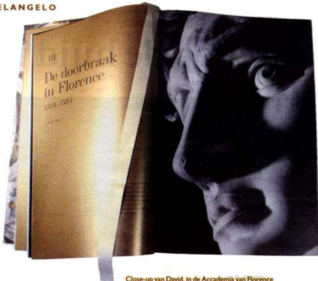
Close-up van David, in de Accademia van Florence