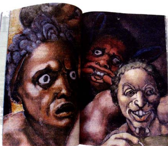
Het Laatste Oordeel (fragment), Sixtijnse kapel

fond. In de jaren dertig schilderde hij het grote Laatste Oordeel op de altaarwand.