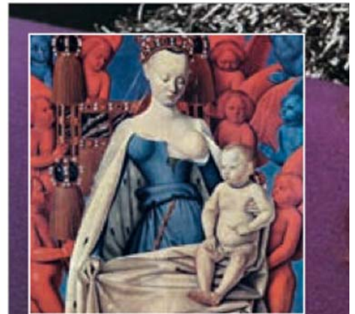
▲ Мадонна Жана Фуке вдохновила Беттину Реймс на создание The book of Olga