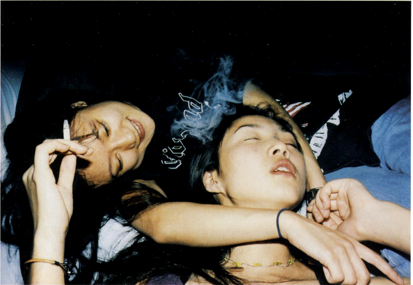
Αριστερά, η Zhang Yufeng (δεξιά), ερωμένη και νοσοκόμα του Μάο. Ακολουθούσε τον «Μεγάλο Τιμονιέρη»σε κάθε σιδηροδρομικό του ταξίδι. Το φόρεμα που φοράει αποτέλεσε σήμα κατατεθέν της κινέζικης μόδας. Επάνω, ξημερώματα, δύο φίλες διασκεδάζουν σε νυχτερινό κλαμπ του Πεκίνου .

Ηταν πολύ σημαντικό για σας να υπάρχουν στο βιβλίο μόνο φωτογραφίες από Κινέζους; «Το βιβλίο είναι αφιερωμένο στην κινέζικη φωτογραφία-ντοκουμέντο. Μερικές φορές κοιτώ στη Δύση και βλέπω πως, σε ό,τι αφορά τη φωτογραφία, οι Κινέζοι είναι λίγο πολύ ξεχασμένοι. Όμως έχουμε καταφέρει απίστευτα πράγματα. Στο βιβλίο προσπάθησα να επιλέξω τις φωτογραφίες, ώστε να αποφύγω τη ρομαντική και την κρατική προπαγανδιστική οπτική της Κίνας».