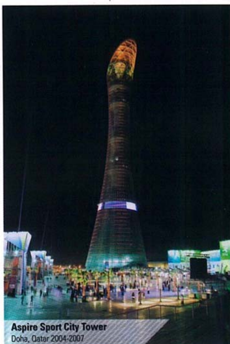
Aspire Sport City Tower Doha, Qatar 2004-2007