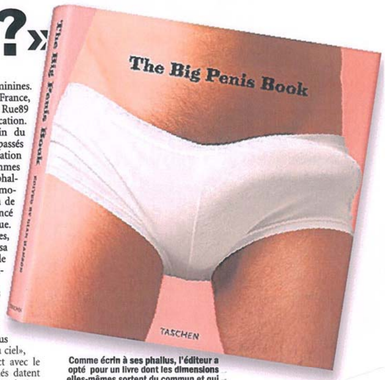
Comme écrivain à ses phallus, l'éditeur a opté pour un livre dont les dimensions elles-mêmes sortent du commun et qui ne passe pas inaperçu en librairie.

Un petit sondage auprès des librairies romandes nous confirme la vigueur des ventes d'un livre arrivé depuis mai sur les rayonnages. Chez Payot Lausanne, il est rangé au rayon Photo-Beaux-Arts. Vu son format, il ne passe pas inaperçu! «Les clients ne viennent pas nous le demander, témoigne cette vendeuse, ils savent tout de suite où le trouver. Pour le moment, je n'ai que des hommes qui m'en achètent... Ils ne sont ni trop jeunes ni trop âgés. Ils ne cherchent pas à le dissimuler en sortant. Cela serait difficile avec la place qu'il prend dans le sac!» Surprise, «The Big Penis Book» s'écoule nettement mieux que «The Big Book of Breasts». Des réactions outrées? «Celle d'un vieux monsieur qui trouvait qu'on ne mettait pas assez en évidence le livre. Il disait que nous n'étions plus au Moyen Age... Pourtant, on ne le cache pas!» rigole notre vendeuse. ■