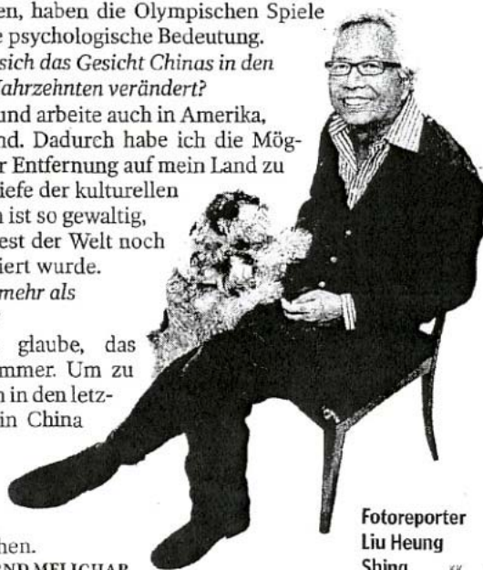
Fotoreporter Liu Heung Shing