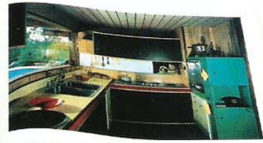
EUGENE WOODSON III Hollywood Residences, Los Angeles, California

LAS MÁS DE 400 FOTOGRAFÍAS DE ESTE LIBRO FUERON SELECCIONADAS ENTRE 260.000 FOTOS DEL ARCHIVO DE SHULMAN DURANTE DOS AÑOS POR EL MISMO BENEDIKT TASCHEN