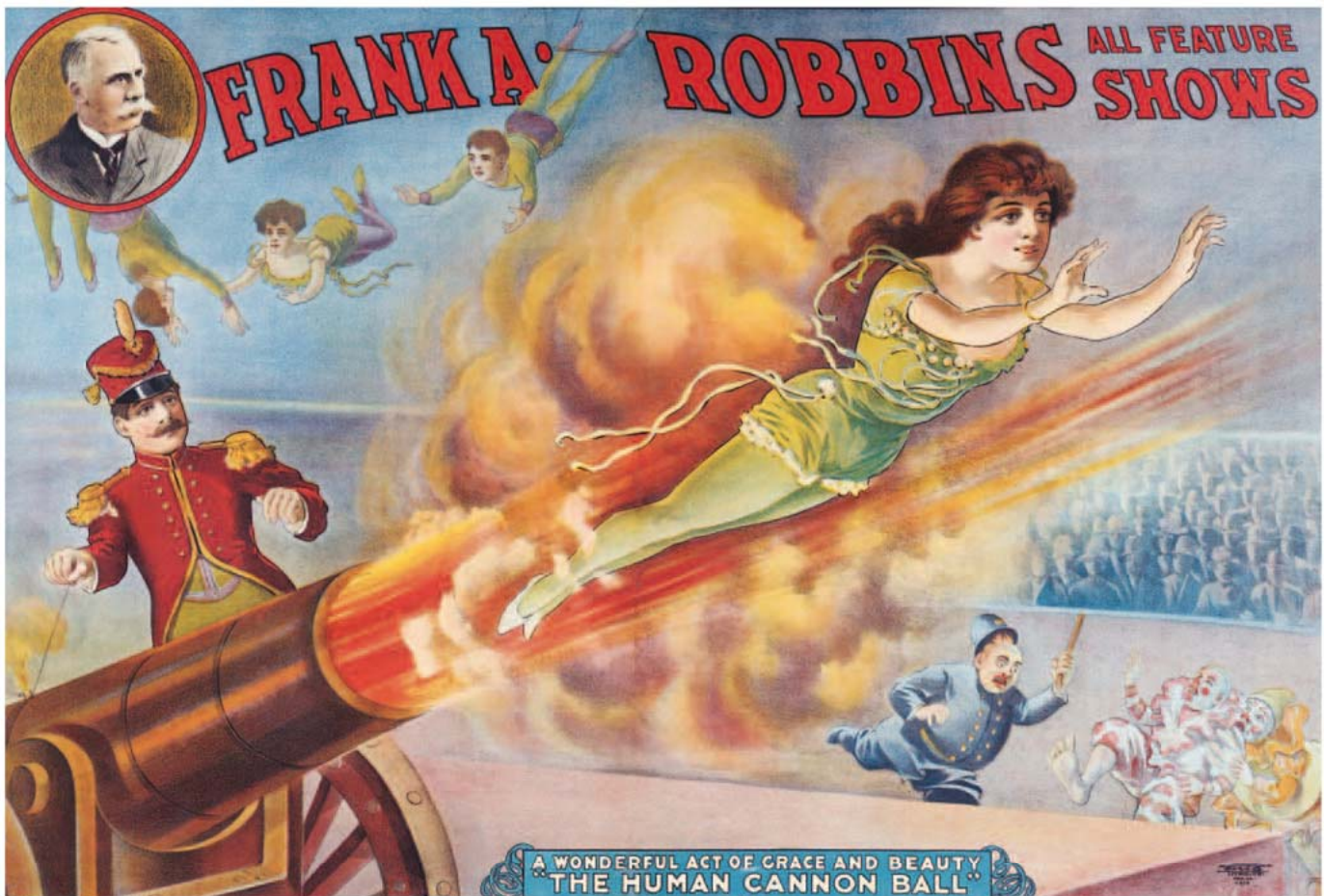
■ Het Frank A. Robbinscircus pakt op het einde van de negentiende eeuw uit met zijn topact: een menselijke kanonskogel.