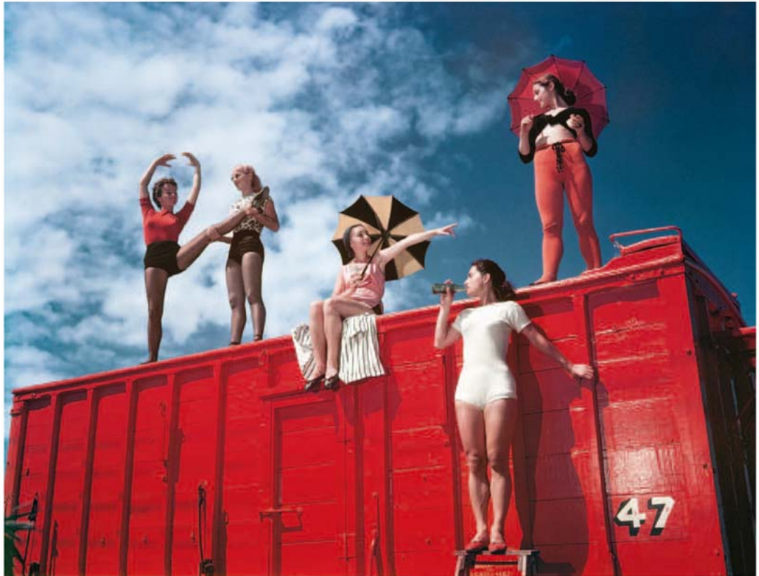
De Amerikaanse fotograaf-cineast Stanley Kubrick legde deze dames van het bekende Barnum & Baileycircus in 1948 op de gevoelige plaat vast.