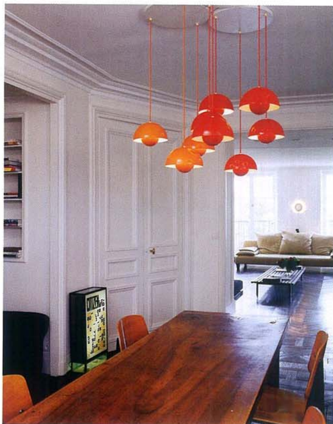
Martin Hattbur

DANS CETTE SALLE À MANGER, UN LUSTRE « FLOWER POT » DE VERNER PANTON EST SUSPENDU AU-DESSUS D'UNE TABLE DE MONASTÈRE. AU SOL, UNE BOÎTE LUMINEUSE DE CHEN ZHEN.