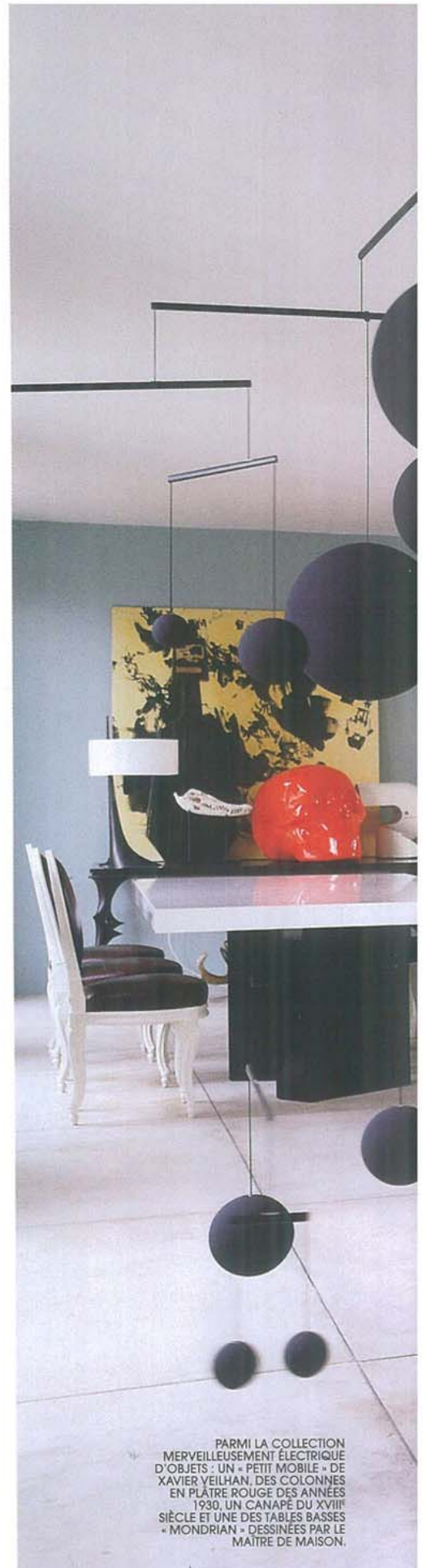
PARMI LA COLLECTION MERVEILLEUSEMENT ÉLECTRIQUE D'OBJETS : UN « PETIT MOBILE » DE XAVIER VEILHAN, DES COLONNES EN PLÂTRE ROUGE DES ANNÉES 1930, UN CANAPÉ DU XVIII e SIÈCLE ET UNE DES TABLES BASSES « MONDRIAN » DESSINÉES PAR LE MAÎTRE DE MAISON.